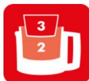
BOLS 3 EN 1