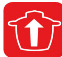
BOL XL 4,8 L jusqu'à 16 personnes