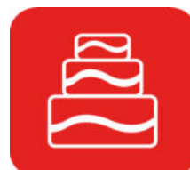
PÂTISSIER XL jusqu'à 16 parts