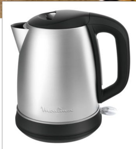
BOUILLOIRE SUBITO SELECT 1.7L INOX BY550D10