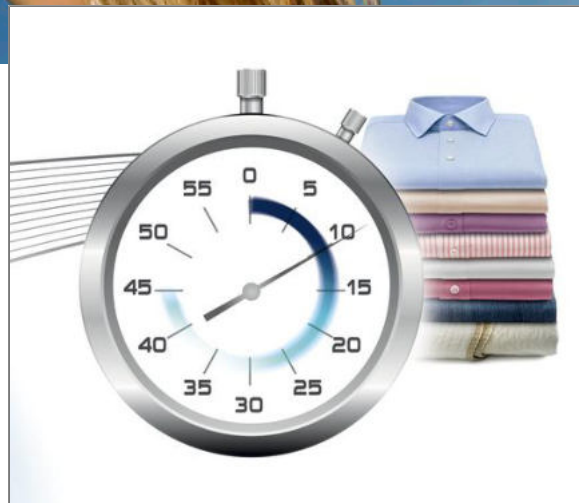
FER A REPASSER EASYGLISS FV3967C0