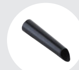
Suceur souple 22302100