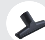
Embout ventouse 22351900