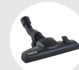
Brosse sols combinée 107418485