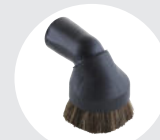
Brosse meuble 22352000