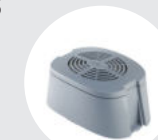
Filtre principal 82147100