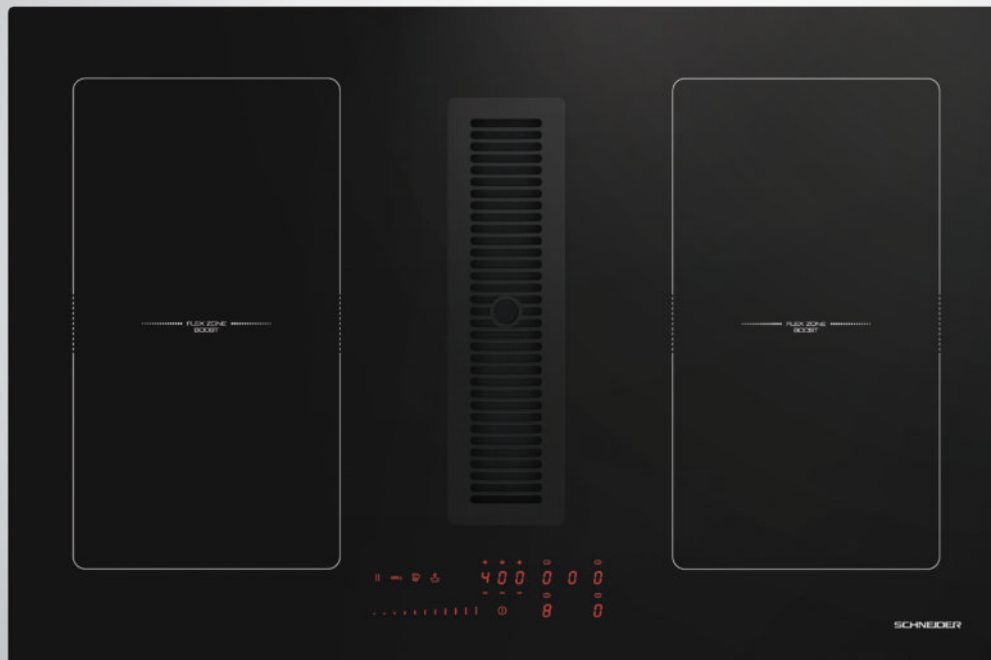
Table aspirante SCVH651AS