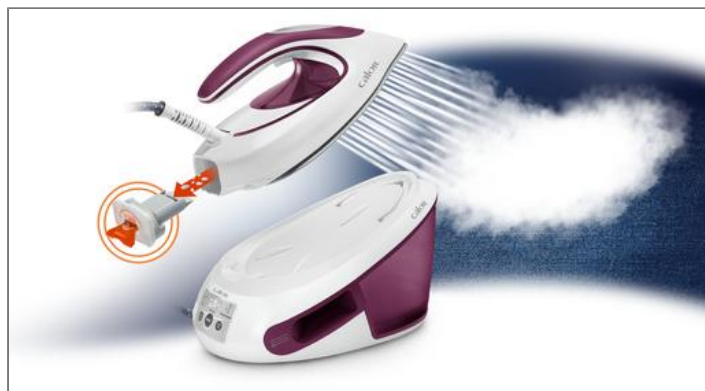
CENTRALE VAPEUR EXPRESS ANTI-CALC SV8054CO