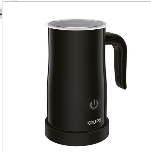
MOUSSEUR A LAIT AUTOMATIQUE NOIR XL100810

Le mousser à lait automatique de Krups vous accompagnera dans la réalisation de toutes vos boissons gourmandes à base de lait